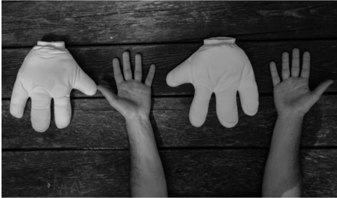
1ers prototypes du costume : Gants à 4 doigts permettant les équilibres sur les mains / 2020