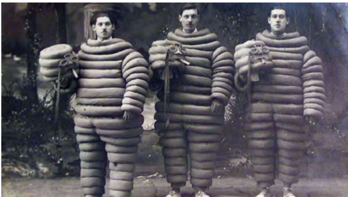
Une reproduction d'une carte postale de 1920, sur laquelle trois ouvriers de l'usine Michelin posent en costume de Bibendum.